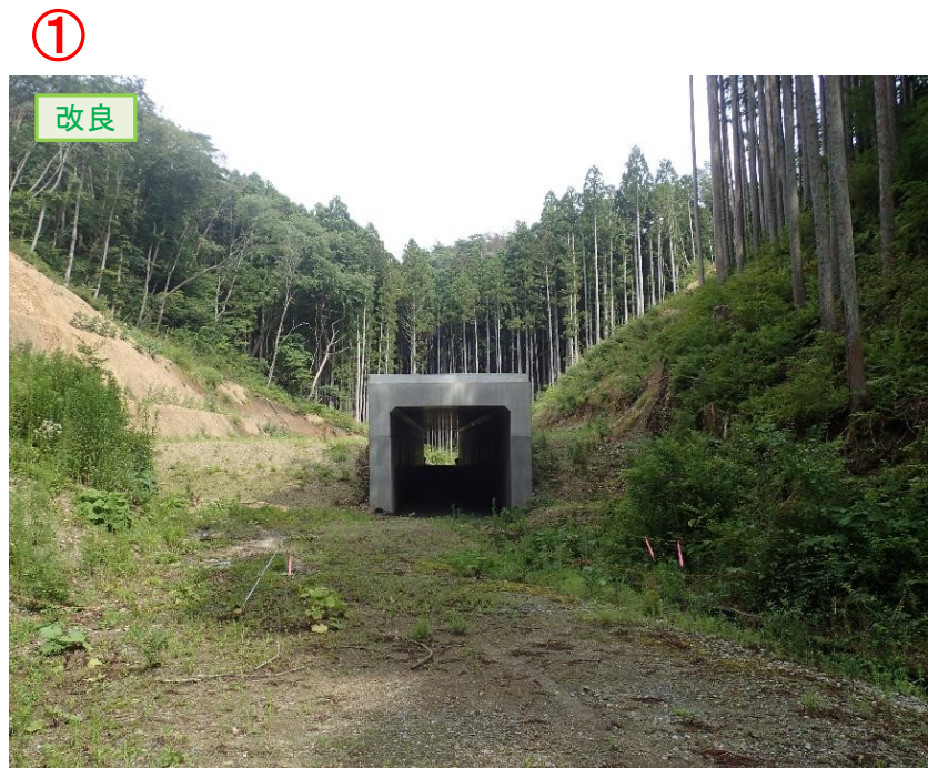
▲No.210西側から本線側に望む [第11号道路函渠]