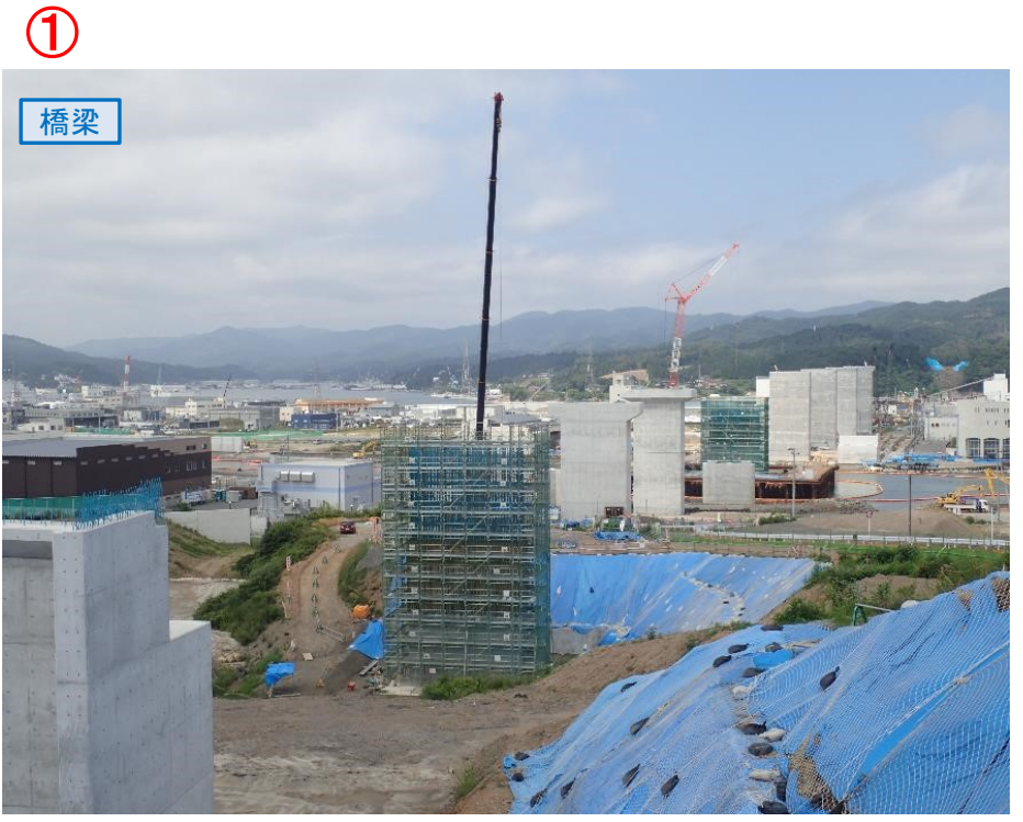
▲No.80東側から終点側を望む [気仙沼湾横断橋(仮)]