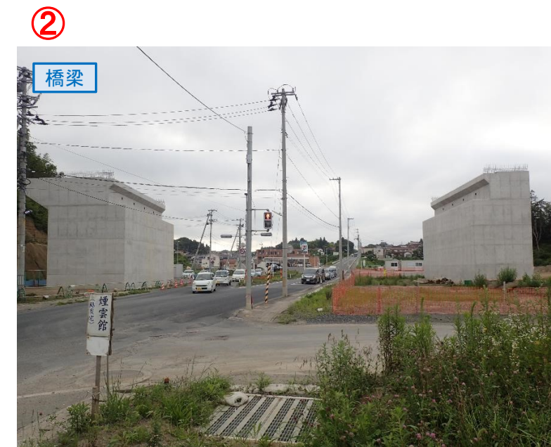
▲No.27南側から本線を望む [片浜跨道橋(仮)]