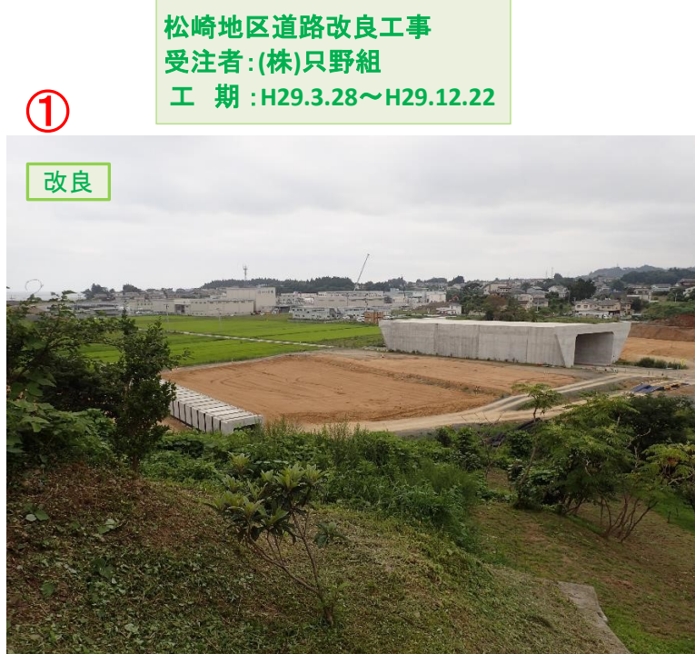
▲No.16北側から本線を望む [左:第4号道路函渠] [右:第3号道路函渠]