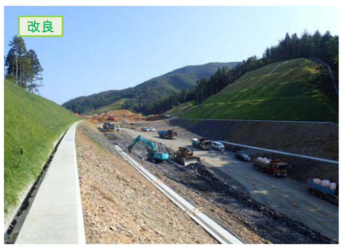
▲No.30から起点側を望む [唐桑北IC(仮)]