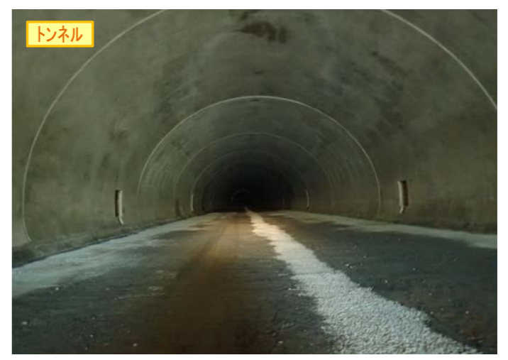
▲県境トンネル(仮)終点側を望む