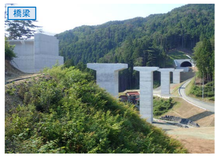
▲No.80東側から終点側を望む [青野沢川橋(仮)]