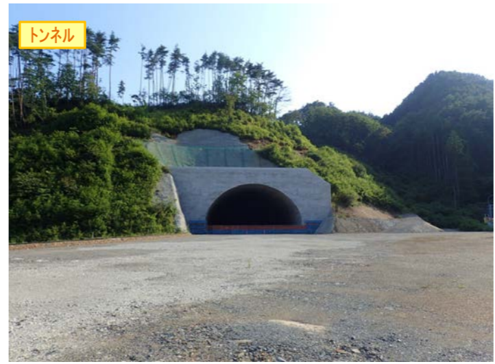
▲No410から起点側を望む [気仙沼第2号トンネル(仮)]