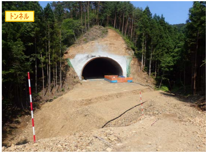
▲No350から終点側を望む [気仙沼第2号トンネル(仮)]