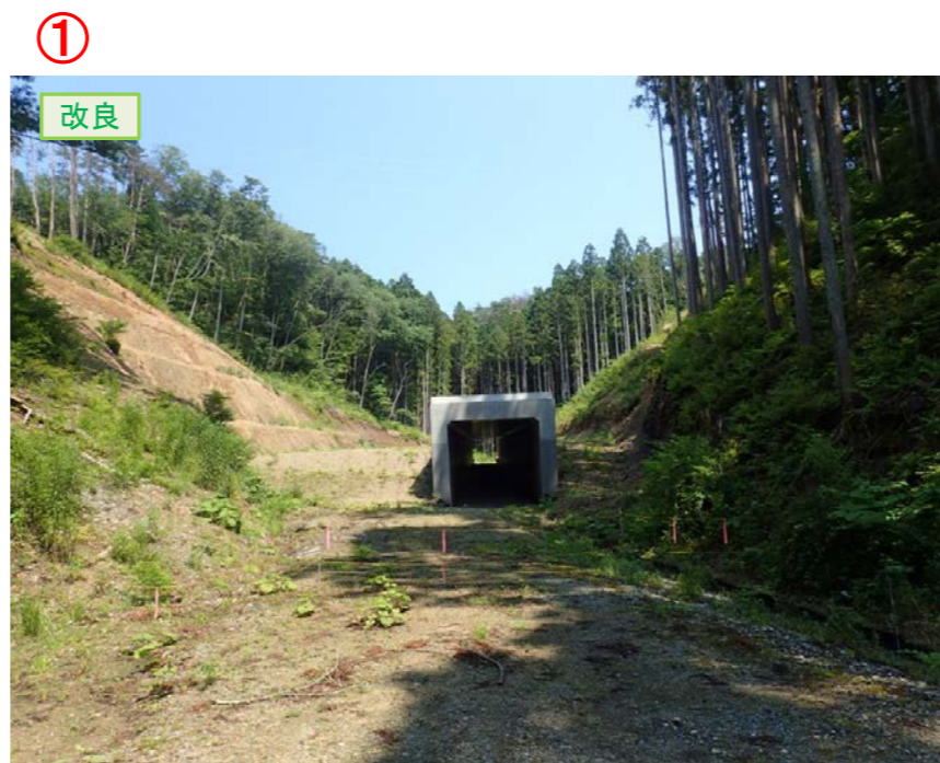
▲No.210西側から本線側に望む [第11号道路函渠]