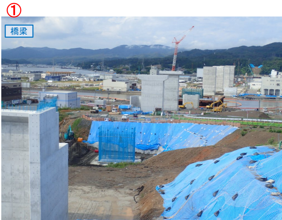
▲No.80東側から終点側を望む 気仙沼湾横断橋(仮)