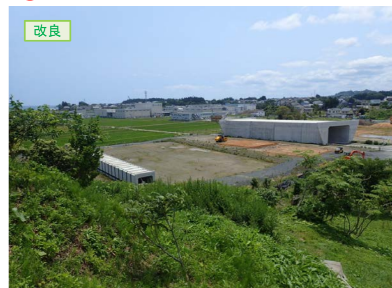
▲No.16北側から本線を望む

① 松崎地区道路改良工事 受注者:(株)只野組 工期:H29.3.28～H29.12.22