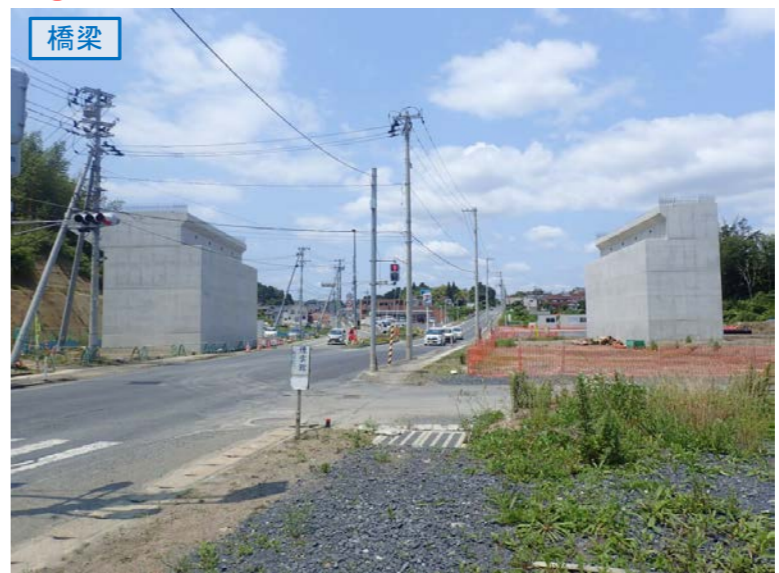
▲No.27南側から本線を望む [片浜跨道橋(仮)]