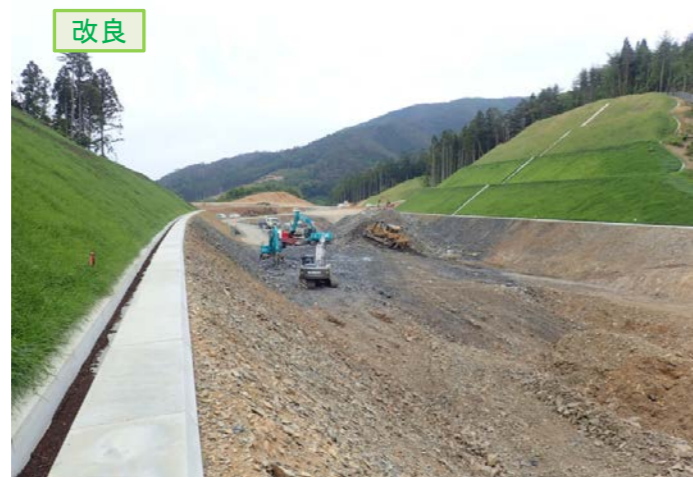
▲No.30から起点側を望む [唐桑北IC(仮)]