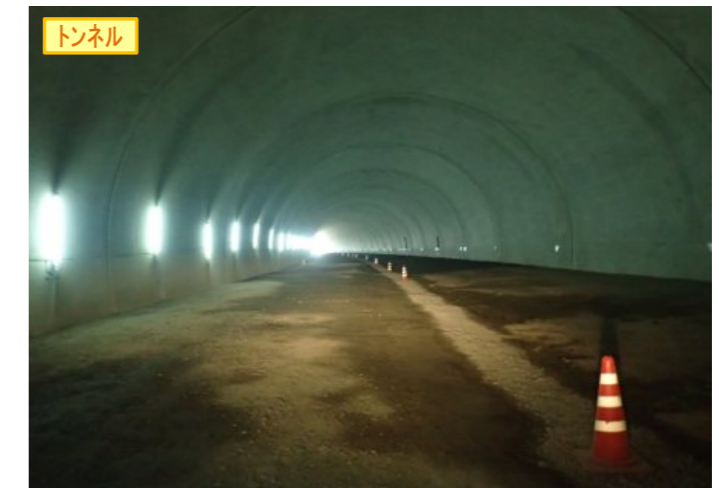
▲県境トンネル(仮)終点側を望む