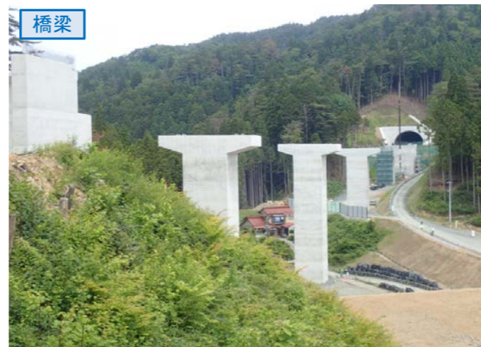
▲No.80東側から終点側を望む [青野沢川橋(仮)]