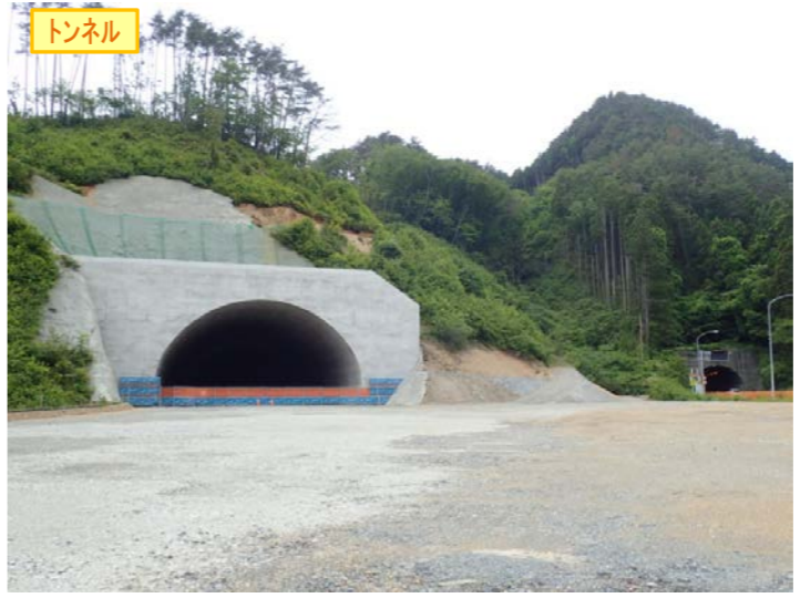
▲No410から起点側を望む 気仙沼第2号トンネル(仮)