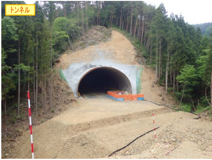
▲No350から終点側を望む 気仙沼第2号トンネル(仮)