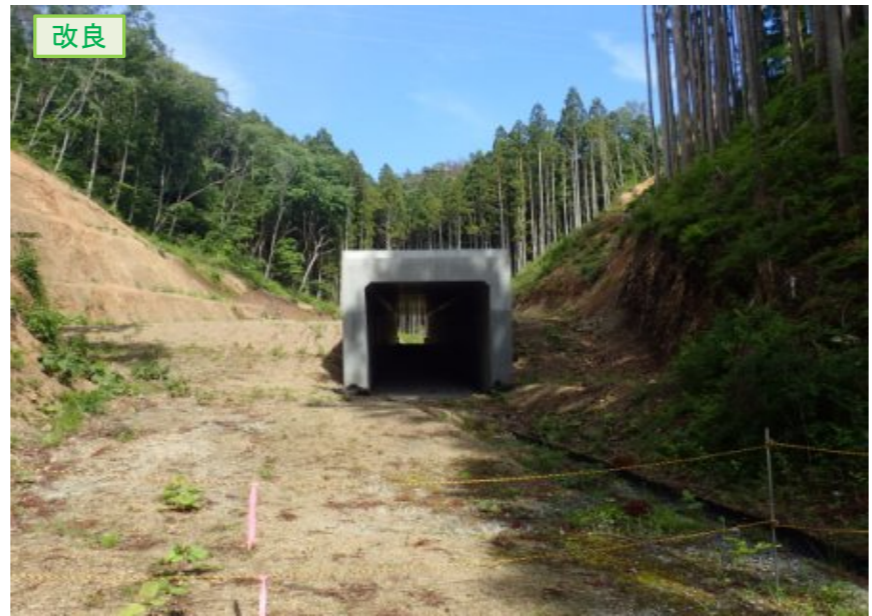
▲No.210西側から本線側に望む [第11号函渠]