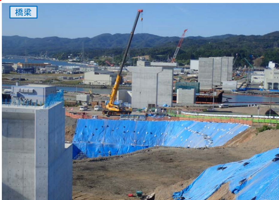
▲No.80東側から終点側を望む