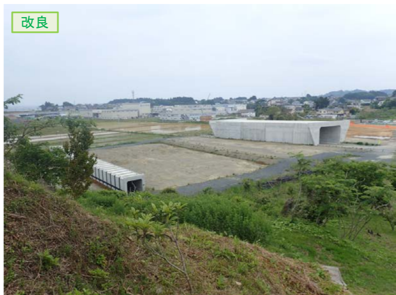
▲No.16北側から本線を望む