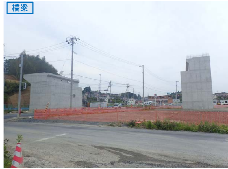
▲No.27南側から本線を望む [片浜跨道橋(仮)]