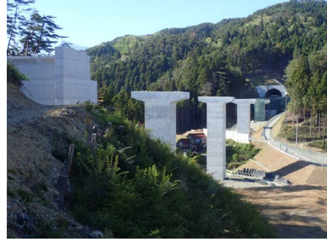
▲No.80東側から終点側を望む [青野沢川橋(仮)]