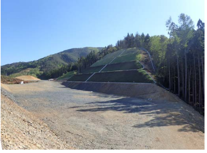
▲No.30から起点側を望む [唐桑北IC(仮)]