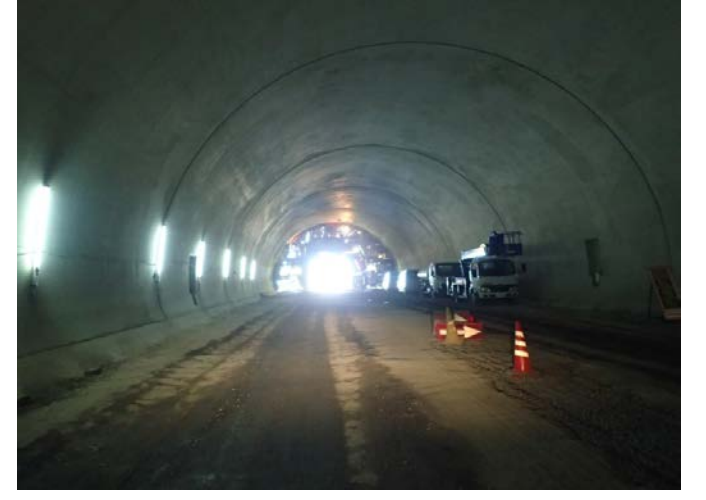
▲県境トンネル(仮)坑内(覆工の様子)