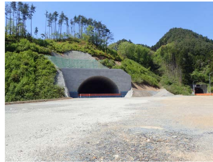
▲No350から終点側を望む 気仙沼第2号トンネル(仮)