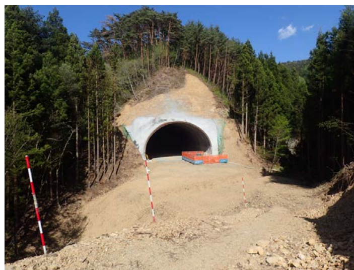
▲No410から起点側を望む 気仙沼第2号トンネル(仮)