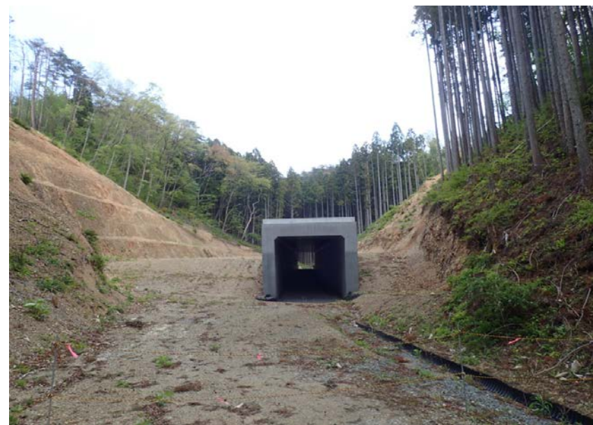
▲No.210西側から本線側に望む [第11号函渠]