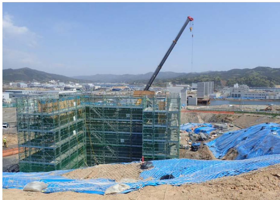
▲No.80東側から終点側を望む