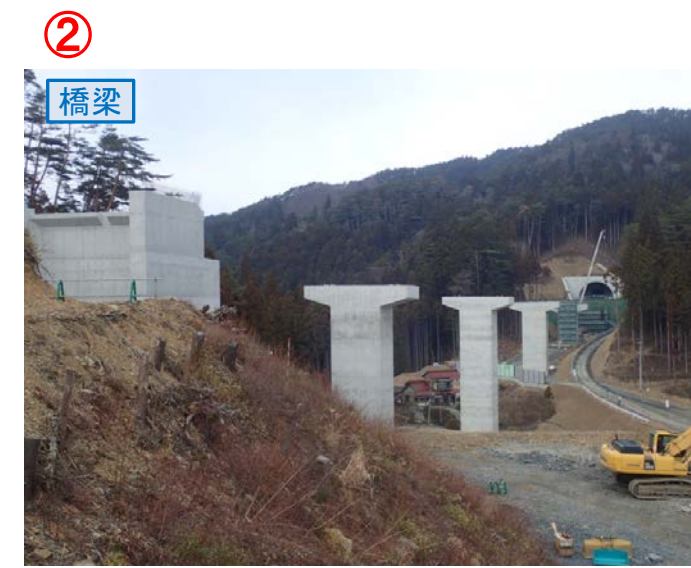
② ▲No.80東側から終点側を望む [青野沢川橋(仮)]