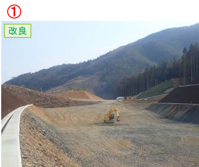
① ▲No.30から起点側を望む [唐桑北IC(仮)]