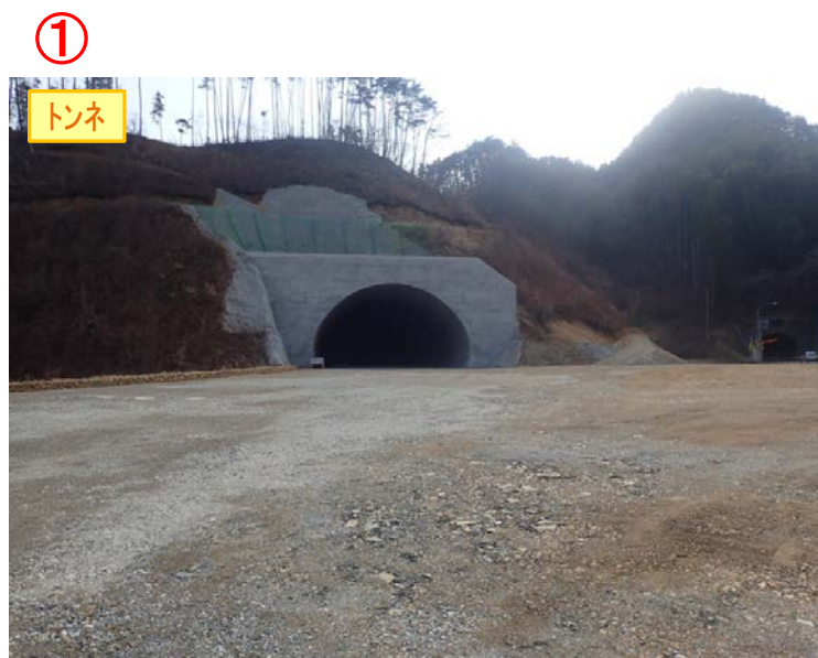
▲No410から起点側坑口を望む [気仙沼第2号トンネル(仮)]