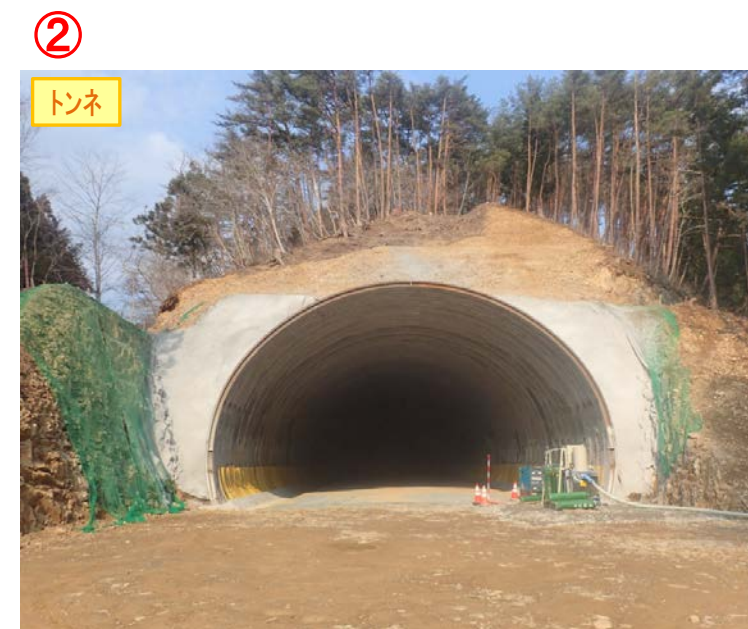
▲No350から終点側坑口を望む [気仙沼第2号トンネル(仮)]