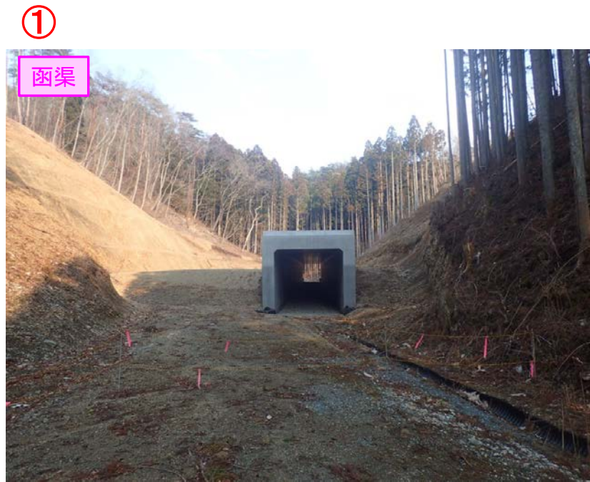
▲No.210西側から本線側に望む [第11号函渠]