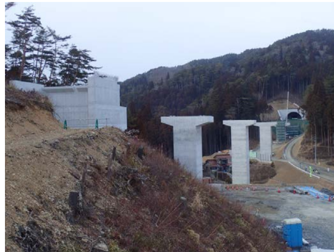
▲No.80東側から終点側を望む [青野沢川橋(仮)]