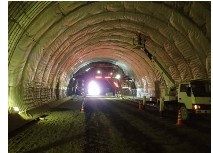
▲県境トンネル(仮)坑内(覆工の様子)