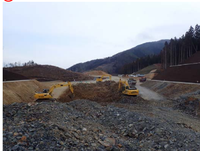
▲No.30から起点側を望む [唐桑北IC(仮)]