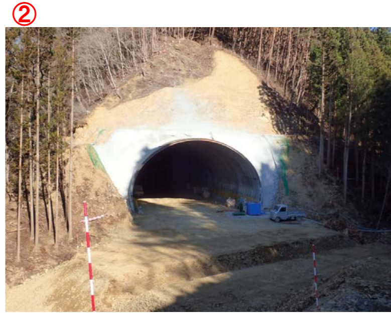
▲No350から終点側を望む 気仙沼第2号トンネル(仮)