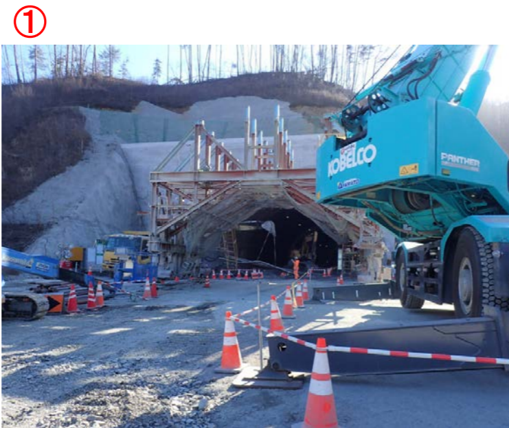
▲No410から起点側を望む 気仙沼第2号トンネル(仮)