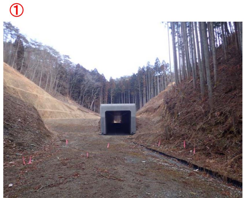
▲No.210西側から本線側に望む [第11号函渠]