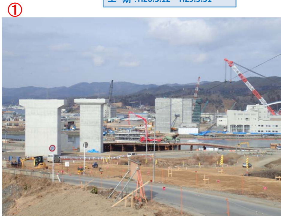
▲No.83東側から終点側を望む