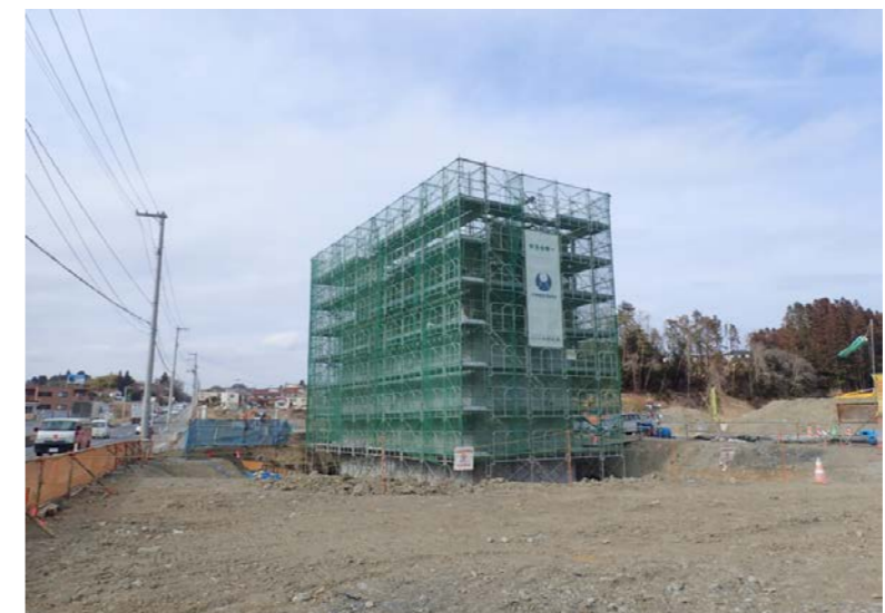
▲No.27南側から本線を望む [片浜跨道橋(仮)]