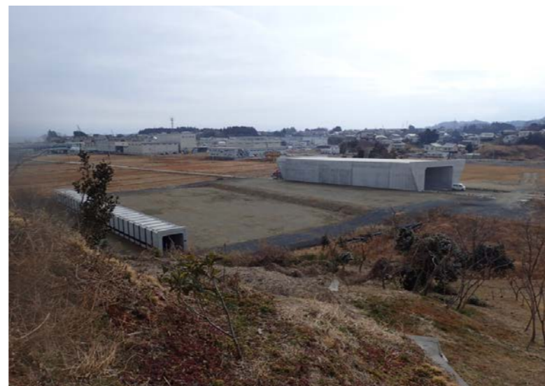
▲No.16北側から本線を望む