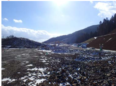
▲No.30から起点側を望む [唐桑北IC(仮)]