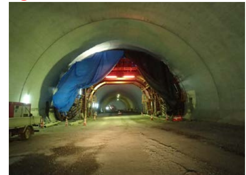
▲県境トンネル(仮)坑内(覆工の様子)