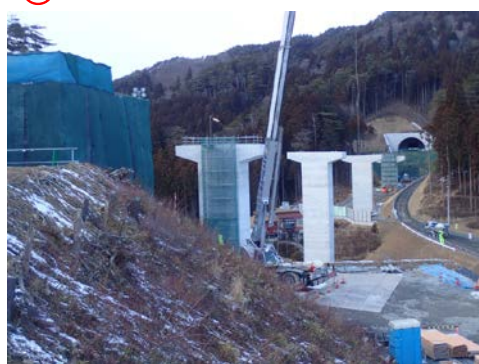
▲No.80東側から終点側を望む [青野沢川橋(仮)]