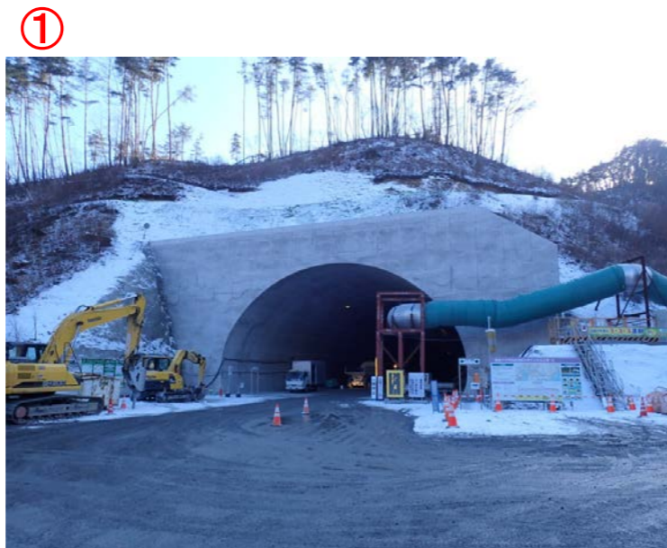
▲No410から起点側を望む 気仙沼第2号トンネル(仮)