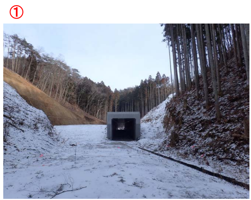
▲No.210西側から本線側に望む [第11号函渠]