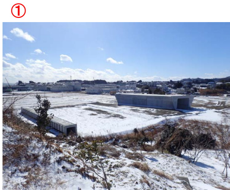
▲No.16北側から本線を望む

松崎浦田地区道路改良工事 受注者:(株)小野良組 工期:H27.5.1～H29.2.28