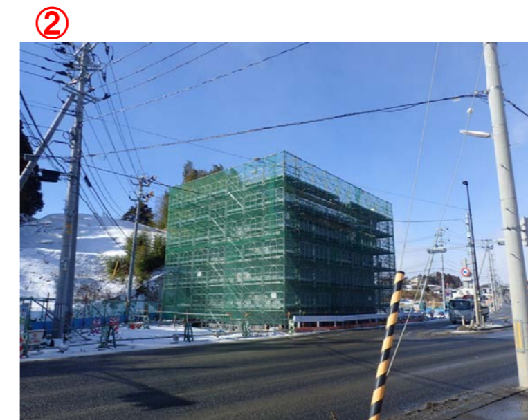
▲No.27南側から本線を望む [片浜跨道橋(仮)]