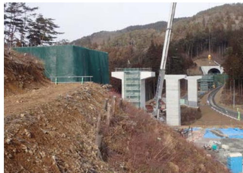
▲No.80から終点側を望む