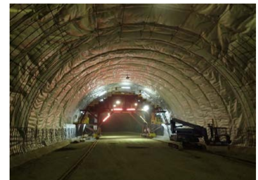
▲トンネル坑内(覆工の様子)