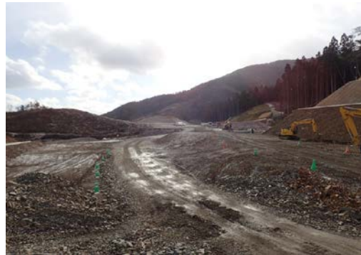
▲No.30から起点側を望む