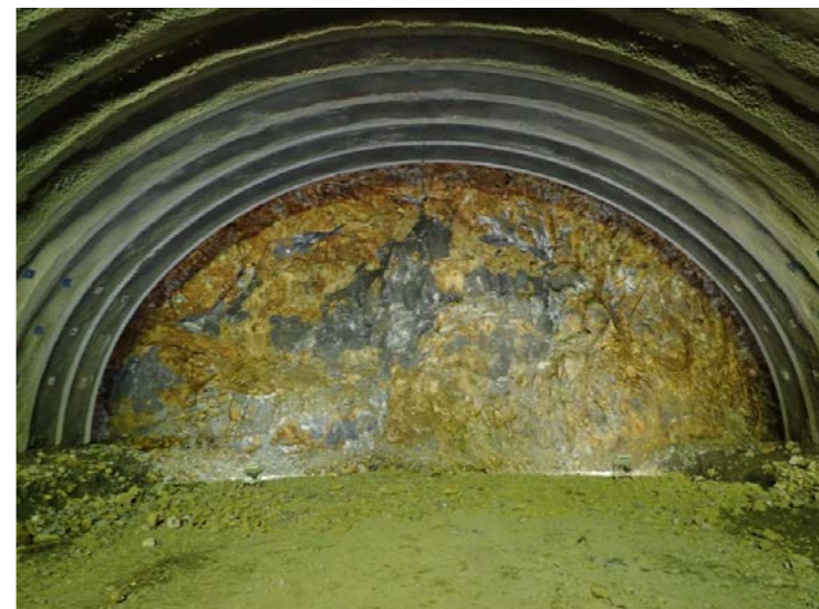
▲気仙沼第2号トンネル内切羽の状況を望む