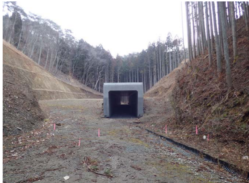
▲No.210付近から本線側に望む