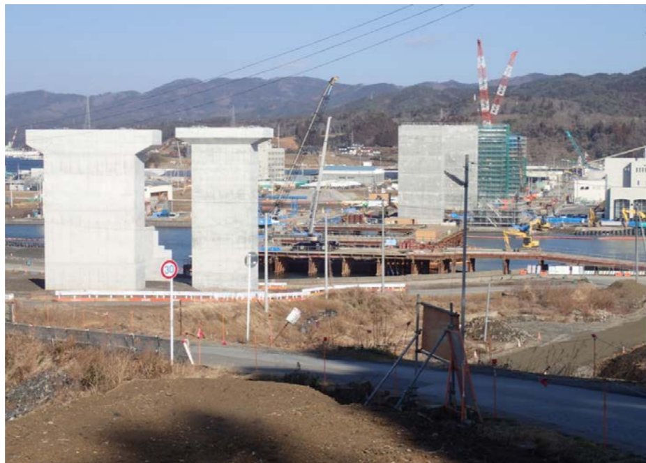
▲No.83付近から終点側を望む