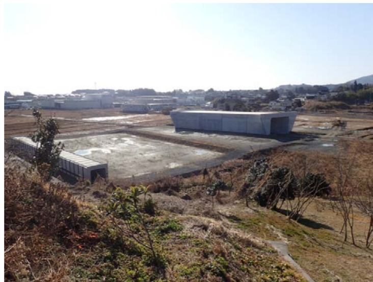
▲No.16付近から起点側を望む