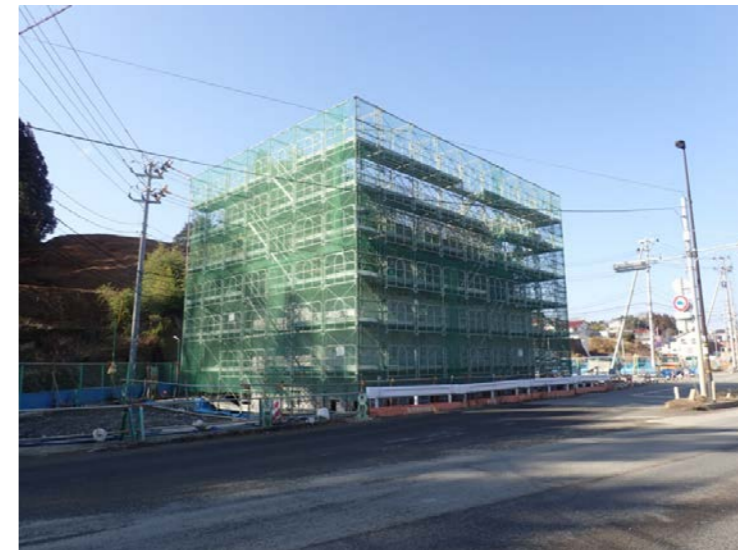
▲No.27から起点側を望む