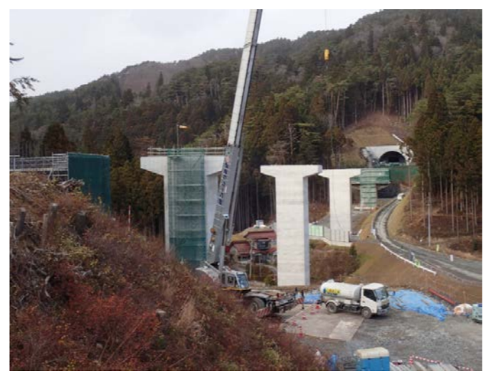
▲No.80から終点側を望む