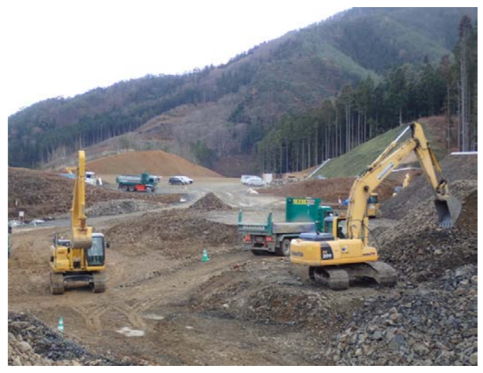
▲No.30から起点側を望む