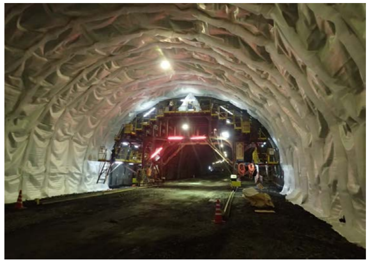
▲県境トンネル坑内(覆工の様子)