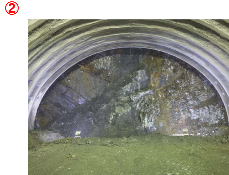
▲気仙沼第2号トンネル内切羽の状況を望む