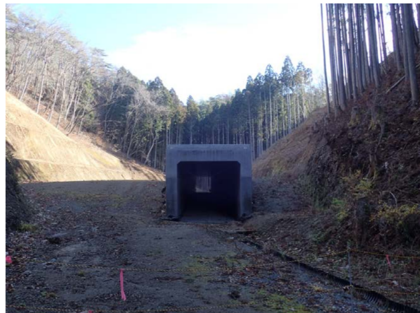
▲No.210付近から本線側に望む