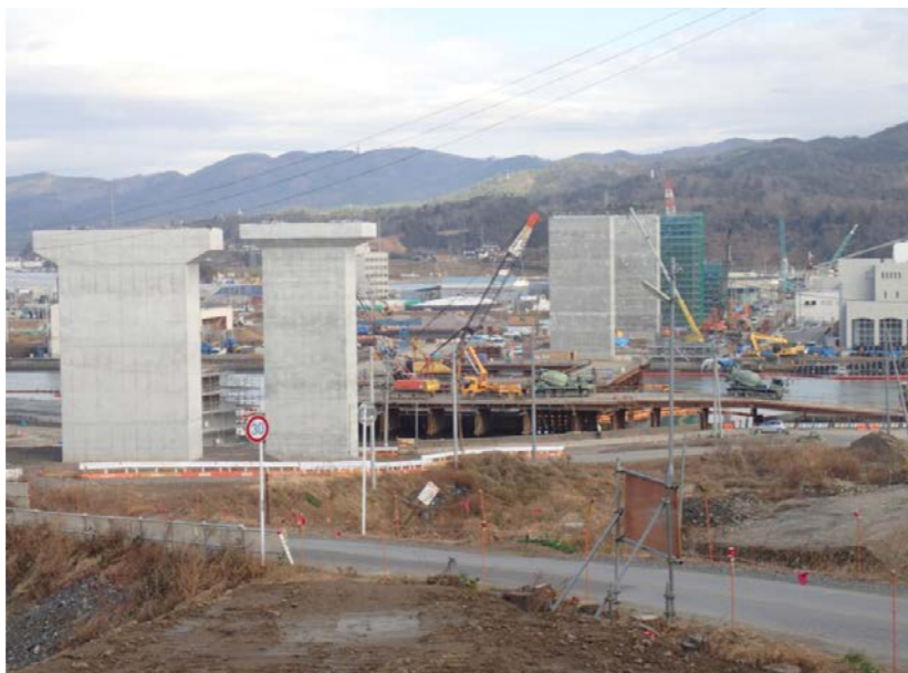
▲No.83付近から終点側を望む