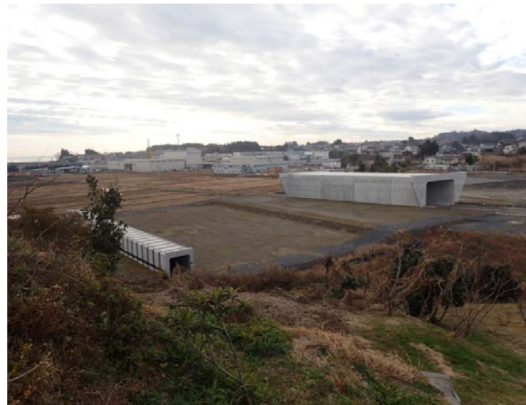
▲No.16付近から起点側を望む