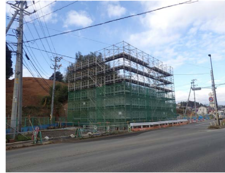
▲No.27から起点側を望む