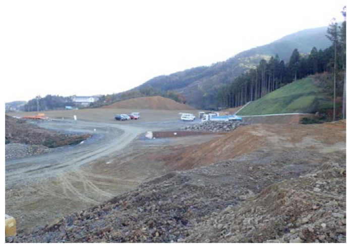
▲No.30から起点側を望む