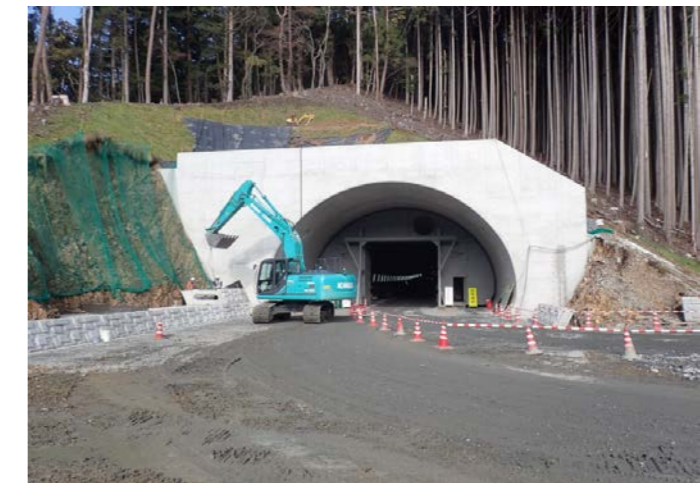
▲No.100から終点側を望む