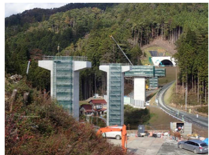
▲No.80から終点側を望む