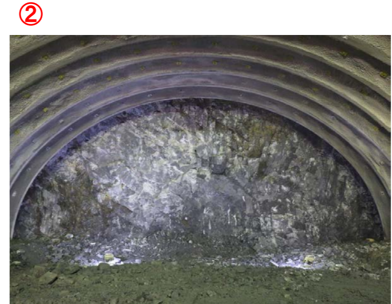
▲気仙沼第2号トンネル内切羽の状況を望む