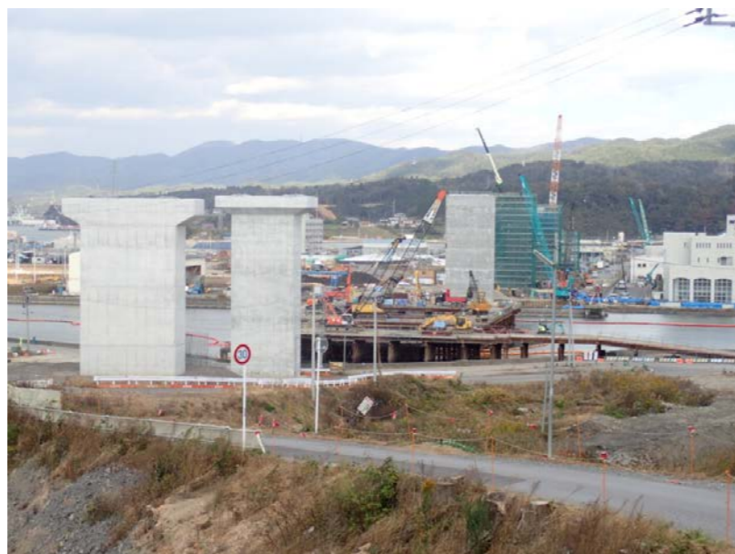
▲No.83付近から終点側を望む