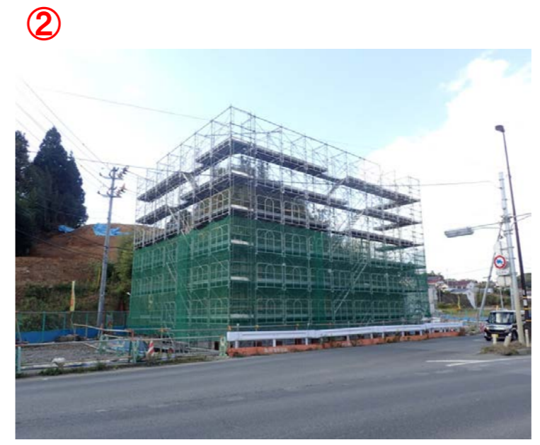
▲No.27から起点側を望む