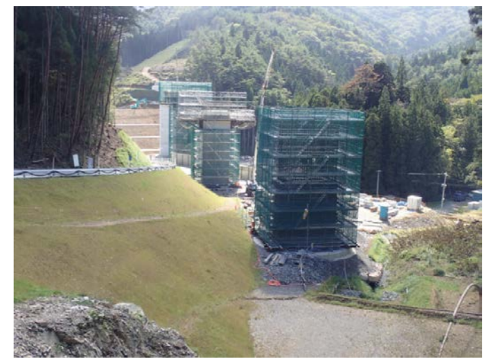
▲No.100から起点側を望む