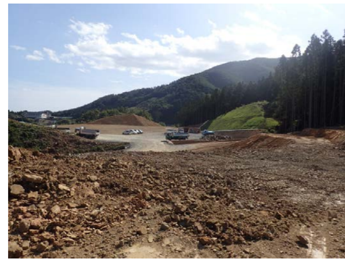
▲No.30から起点側を望む