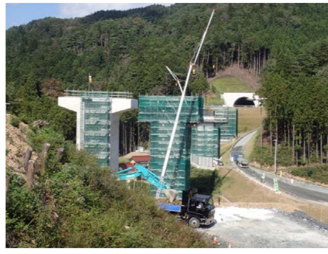
▲No.80から終点側を望む