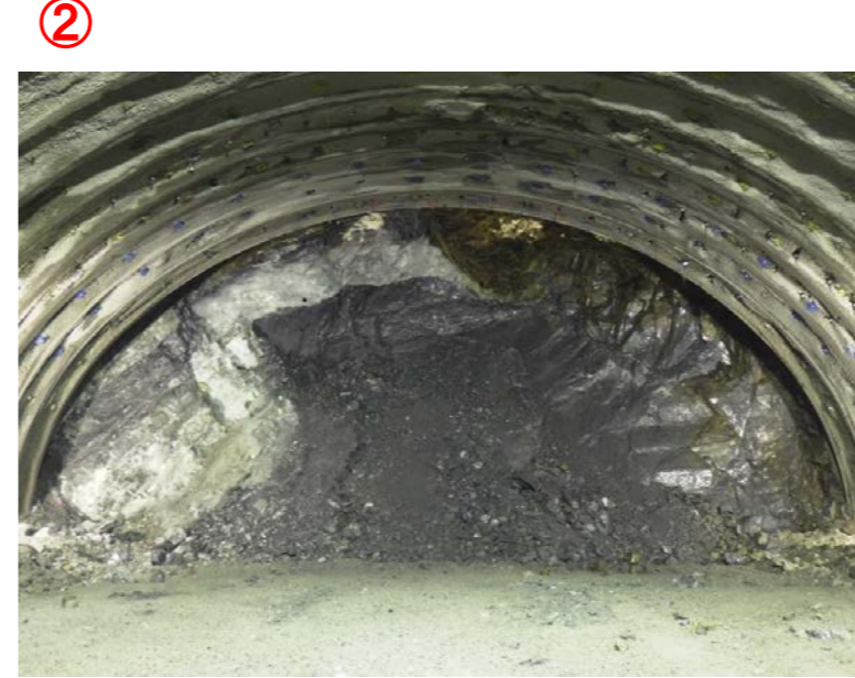
▲気仙沼第2号トンネル内切羽の状況を望む