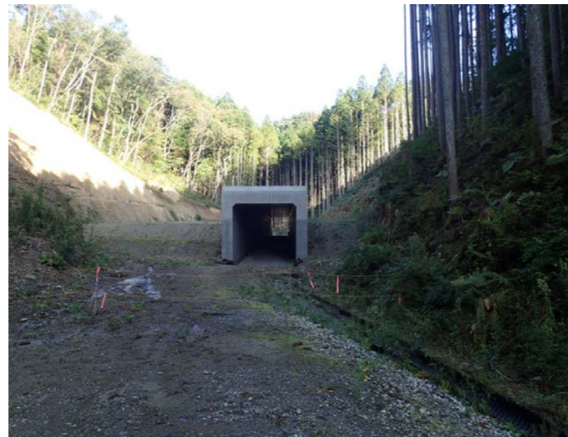
▲No.210付近から本線側に望む