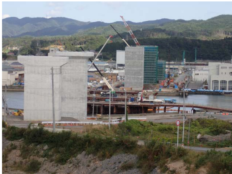
▲No.83付近から終点側を望む