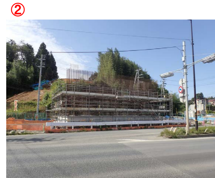
▲No.27から終点側を望む