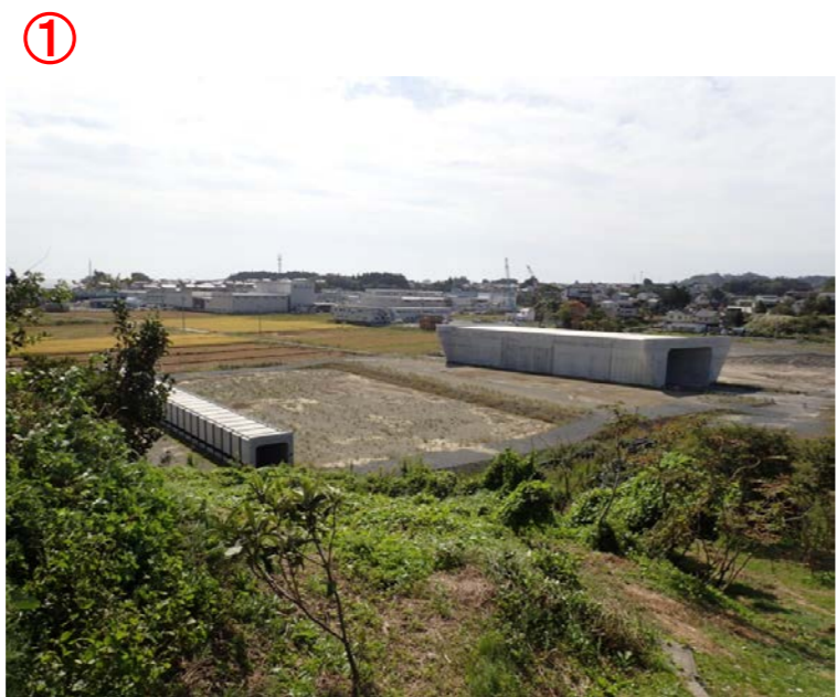
▲No.16付近から起点側を望む

松崎浦田地区道路改良工事 受注者:(株)小野良組 工期:H27.5.1～H28.9.30