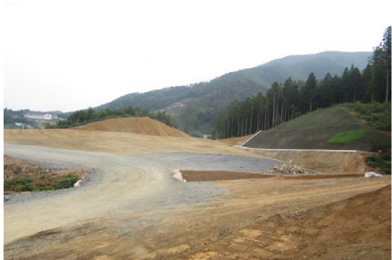
▲No.30から起点側を望む