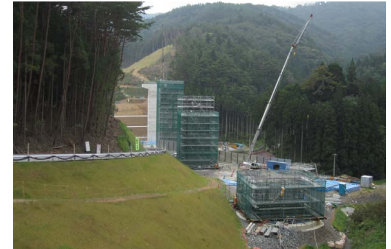
▲No.100から起点側を望む