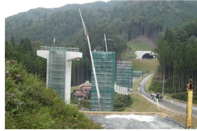
▲No.80から終点側を望む