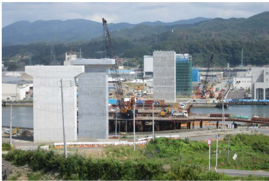
▲No.83付近から終点側を望む